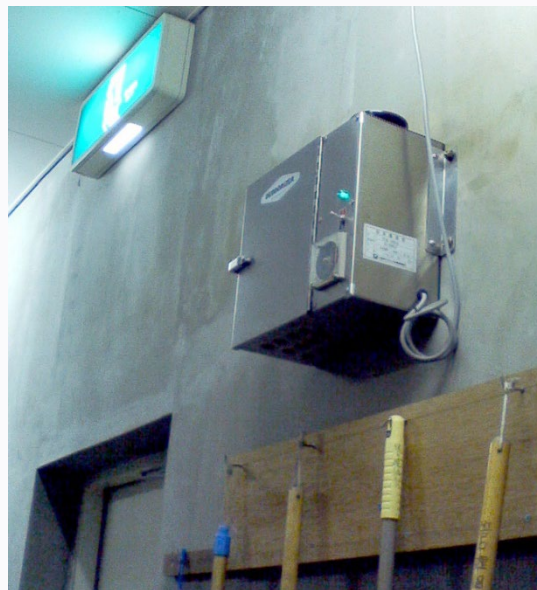
中和消臭器 VK-102AT II

植物精油消臭剤による中和消臭。消臭成分が気体となってゴミ置場内に広がり、腐敗臭を緩和します。出入口近くに取り付けて、外部へのおい漏れも防ぎます。