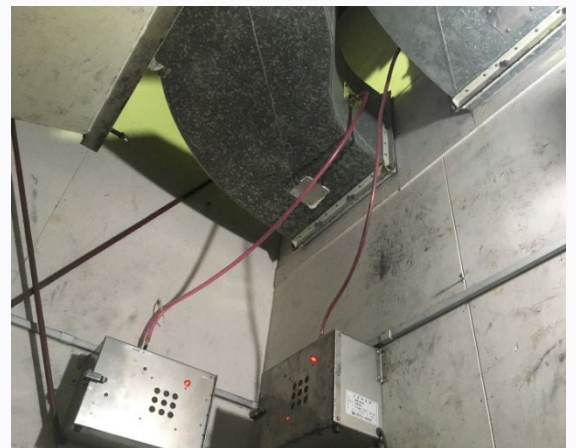
中和消臭器 DMD-02AT II

塗装臭特有の刺激的な感じが和らぎ、臭質が改善されました。排気後も消臭反応が続くため、においの広がりを抑えることができ、周囲に塗装臭はしていません。