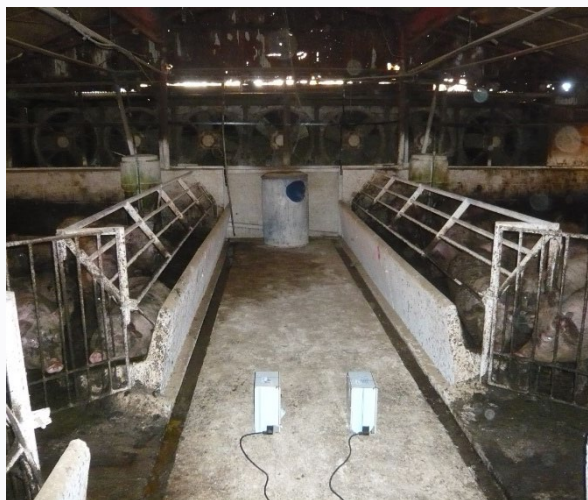
中和消臭器 DMD-02AT II

畜舎入り口から消臭剤を発散し、気流に乗せて場内全体に広がります。におい対策が必要な時だけ運転すればよいので、「消臭剤の無駄な消耗がなく、手軽に使える便利が良い」とのご感想をいただきました。