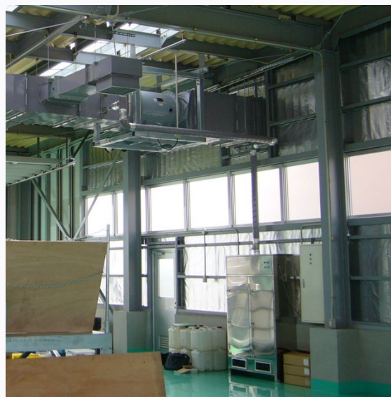
中和消臭器 VFD-SRX シリーズ

液体肥料製造装置の排気ダクトに消臭剤を混入し、生ゴミ臭と反応させます。何種類かある消臭剤の内、発酵臭に効果的なストロングブレンドを選定。臭気の強さに合わせて、消臭剤の発散量も切り替え運転しています。