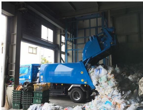
中和消臭器 DMD-02AT II

施設内の悪臭は低減し、作業員の方からも「ニオイがしなくなったし、消臭剤の香りも気に入った」と笑顔でご感想をいただきました。他社とは違う気体の消臭剤です。2週間ほどテストし、ご納得いただいてから導入が決まりました。