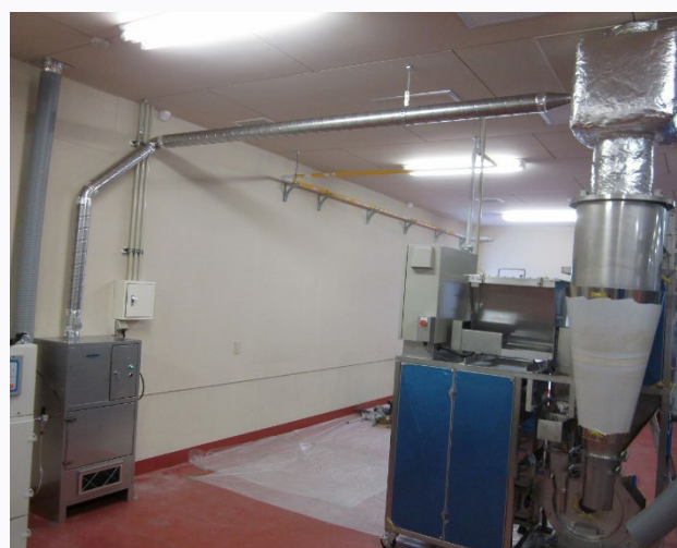
中和消臭器 VFD-SRX シリーズ 現場：愛知県

高温臭気にも対応可能な中和消臭器を採用。 2種類の消臭剤を併用して消臭力をアップしました。 においと消臭剤がよく反応するよう、チャンバーを設けて接触率を上げています。