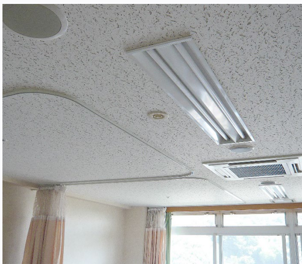
森林浴消臭器 PE-106XA、PE-108XA 現場：神奈川県

配管工事が必要なため新築物件向けですが、目立たず設置でき施設内をまとめて消臭できる利点があります。