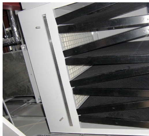
吸着脱臭フィルター KCF-20 現場：愛知県

法要室の排気ダクトに吸着脱臭フィルターを設置し、線香臭を低減してから排気します。脱臭器設置後は気になる線香臭もなく良好です。