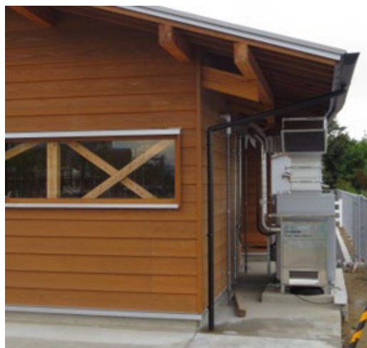
中和消臭器 VFD-1020NO (特別仕様) 現場：新潟県

飼育舎や保健所棟の排気ダクトに、それぞれ消臭器を導入。排気に消臭剤を混入してにょいと反応させます。 施設のオープン後、夏場でも動物臭が気にならないと好評です。