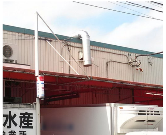
中和消臭器 DVD シリーズ

すでに稼働中の工場で設置スペースも限られていたため、コンパクトタイプの中和消臭器で対応しました。消臭剤はシトラスミントを使用。排気生の臭さもなくなり、工場関係者の方からも高評をいただきました。