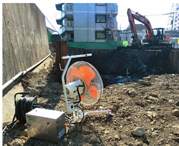
中和消臭器 DMD-02AT II

オープンスペースのため吸着剤による脱臭法では対応が難しく、当社の中和消臭法が採用されました。コンパクトタイプのDMDシリーズは持ち運びも簡単で、掘削場所に合わせて移動しながら消臭剤を発散させることができます。