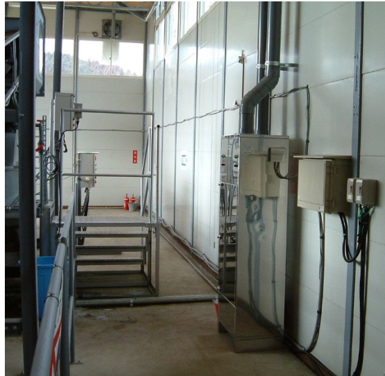
中和消臭器 VFD-SRX シリーズ

シャッターの上方から消臭剤を吹き出すことで、出入口に消臭エアーカーテンを施すことができます。コストをあまりかけず臭い対策ができました。